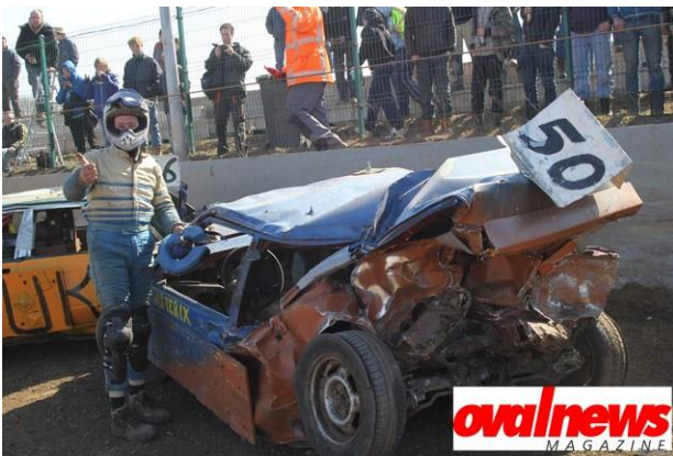
Het lot van Bangerraces

De openingsraces afgelopen zaterdag waren een groot succes. Met een 44 Formule 1 Stockcars, maar liefst 37 F2 stockcars, 17 junioren en jawel hoor, 100 bangerrijders aanwezig. Ook het publiek was in grote getale gekomen. Dank aan iedereen.