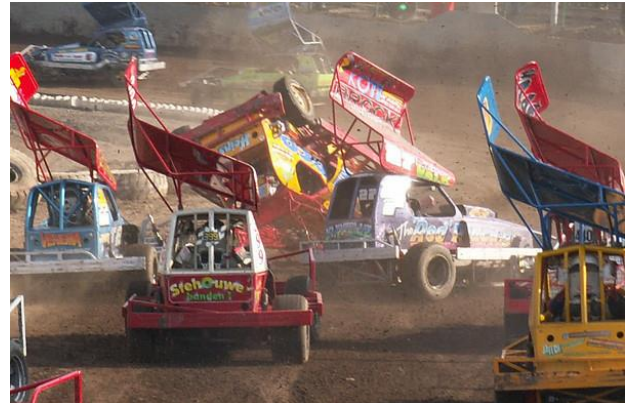
Na "enkele meters lifting" voelde Wierd Gietema toch weer vaste grond, hetzij via het dak.

De wedstrijden zullen aanvangen om 12:00u Locatie: Veenackers 35, 7881 XA Emmer Compasuum.