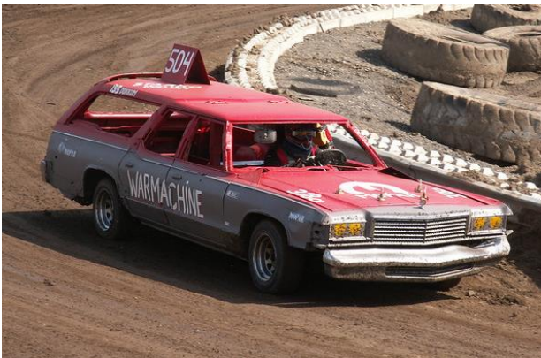
#504 Louis Lijklema in een Dodge Monaco estate V8

Met zoveel inschrijvingen kreeg het publiek ook nog 2 All-comers races voorgeschoteld. Met in iedere wedstrijd 40 wagens werd het een waar slagveld.