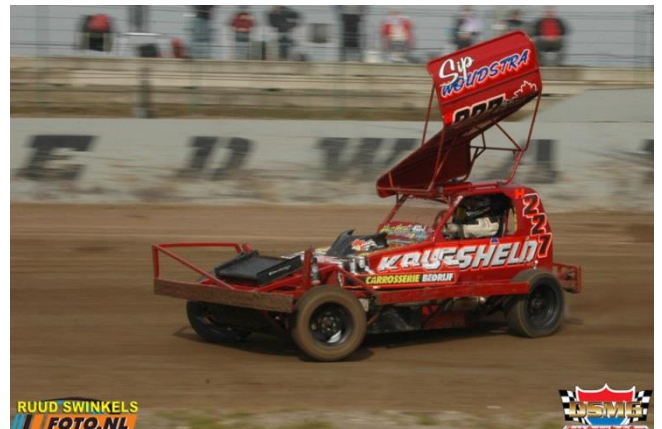
#227 Sip Woudstra dit jaar weer op de baan.