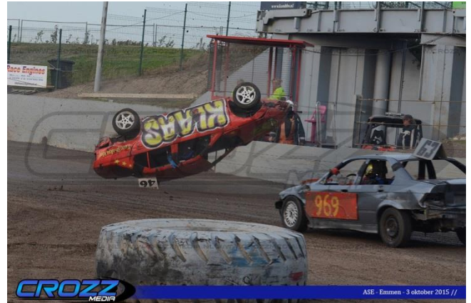
#46 Klaas Petter probeert te vliegen in de.

De derde omloop ging op dezelfde manier als de tweede, eerst 2 heats FWD's. Wederom reden ze harde races, en waren er veel uitvallers. En wel ook weer allemaal zeer sportief opgevat.